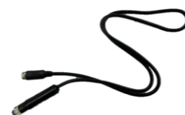
SSS-EK100 バッテリー延長ケーブル(1m)