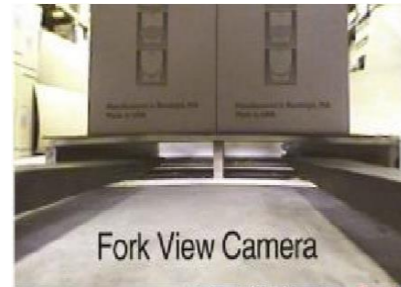
Fork View Camera