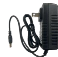
SSS-AC01 モバイルバッテリー充電器 (SSS-SB01/03専用)