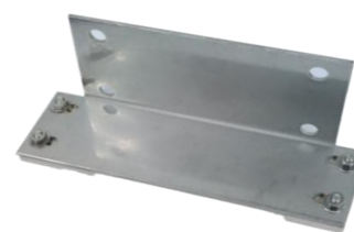
SSS-ST03 SSS-CN03専用 マグネットステー

■主な製品の仕様 バッテリー容量 : 6,000mAh 電池 : リン酸鉄リチウムバッテリー 防水レベル : IP65 動作電圧範囲 : 10~14.4V 電圧 : 12.8V±10% 充電時間 : 4~5時間 連続使用時間 : 20~25時間(カメラ・モニター使用時) 電池残量表示 : LED4段階表示 本体サイズ : W182×H95×D46mm (シリコン部含む) 重量 : 約1,500g