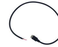
在庫希少 SSS-DS01 SSS-CN01/02用 電源ケーブル(0.5m)