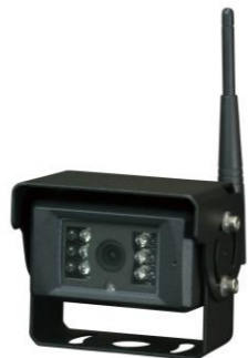
SSS-CB01 バックカメラ 在庫希少