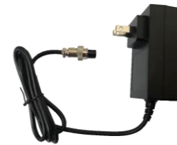
MAS-FB002 モバイルバッテリー充電器 (MAS-FB001専用)