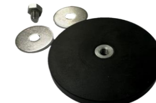
SSS-CBB2 バックカメラ(SSS-CB01)専用 マグネットベース