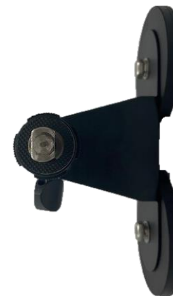
MAS-BR007 モニター専用マグネットステー