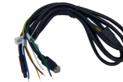
在庫希少 SSS-KB01 バッテリー接続モニター電源ケーブル (1.8m)SSS-SM01専用