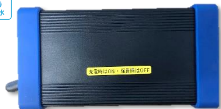
MAS-FB001 カメラ・モニター対応 モバイルバッテリー (リン酸鉄リチウムイオン)

■主な製品の仕様 バッテリー容量 : 6,000mAh 電池 : リン酸鉄リチウムバッテリー 防水レベル : IP65 動作電圧範囲 : 10~14.4V 電圧 : 12.8V±10% 充電時間 : 4~5時間 連続使用時間 : 20~25時間(カメラ・モニター使用時) 電池残量表示 : LED4段階表示 本体サイズ : W182×H95×D46mm (シリコン部含む) 重量 : 約1,500g