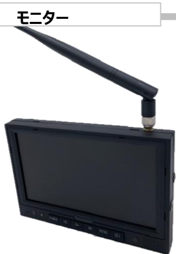
SSS-SM01 7インチモニター 録画対応・非防水

■主な製品の仕様 解像度 : 800×480×3(RGB) カメラ入力 : 4チャンネル カメラトリガー : 4本 画面表示 : 最大2画面 録画方式 : MPEG4(.AVI) 録画メモリ : 8GB~128GB 記録媒体 : microSD 定格電圧 : DC12~32V ケーブル長 : 約50cm 本体サイズ : W100×H25×D50mm