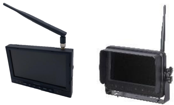
録画または防水対応モニター